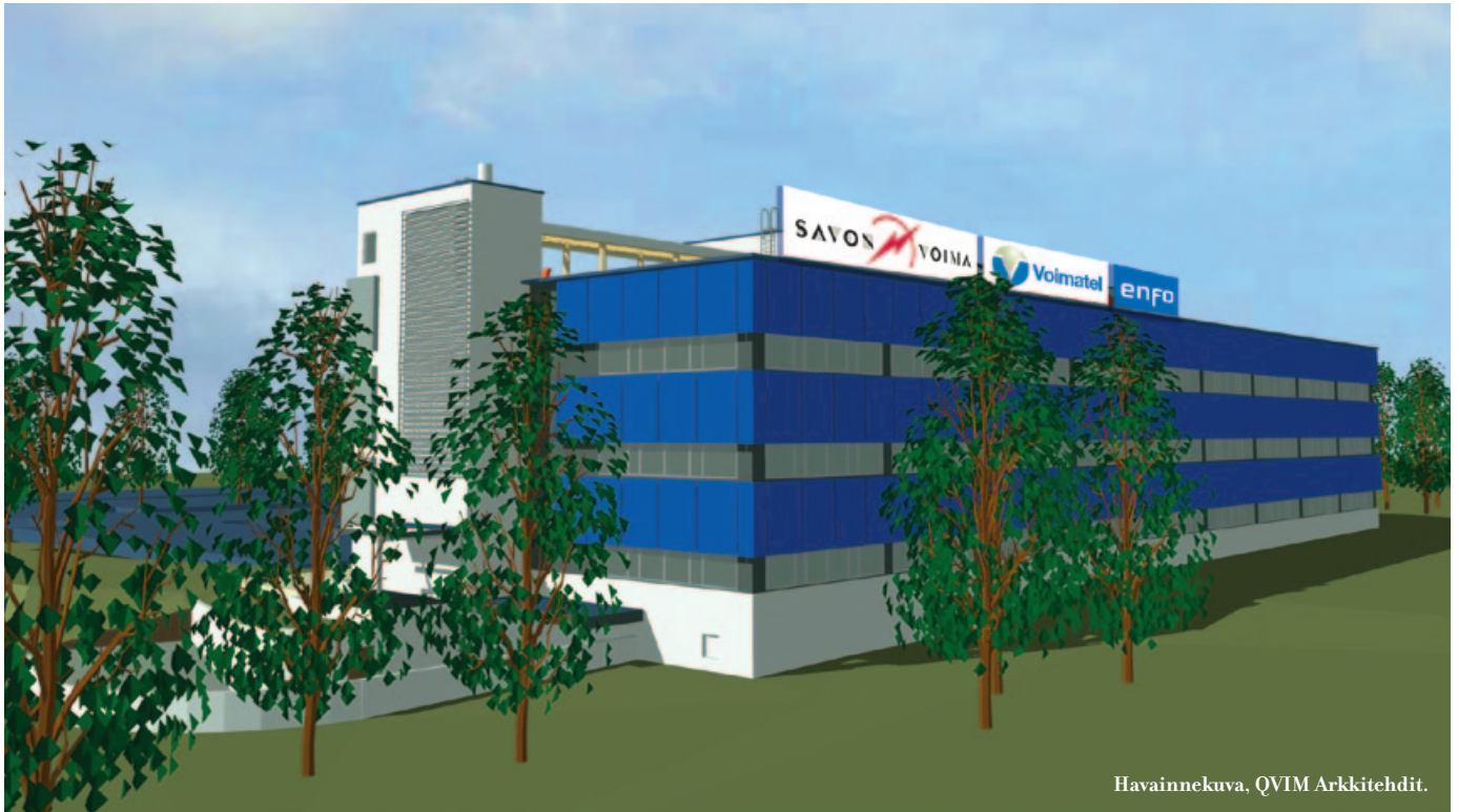
Havainnekuva, QVIM Arkkitehdit.